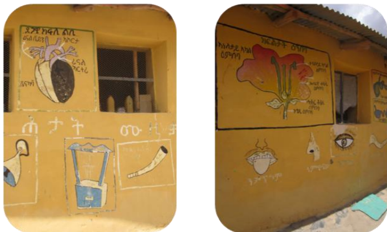
Ejemplos de esta actividad en las paredes exteriores de las aulas de Bidera

En el caso representado, en las paredes de la escuela aparecía parte del cuerpo humano (la cara y los hombros), el abecedario occidental, un avión y un caballo. Con Aprenent de les parets , las artistas quisieron transmitir una realidad que a menudo tenemos demasiado lejos, pero que sería bueno que nunca olvidáramos.