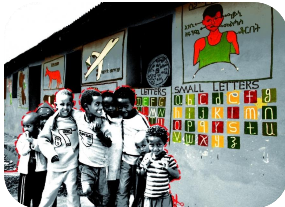
Mural diseñado para la ocasión por Nerea Amorós y Anna Adserà